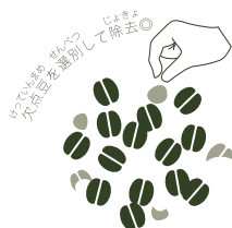
ハンドピッキング